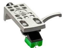
Abbildung 1: Tonabnehmer

Durch den Tonabnehmer wird das Audiosignal tontechnisch verarbeitet und hörbar gemacht. Die Schwingungen werden durch die Plattenrillen gleitende Nadel aufgenommen. Wir unterscheiden zwischen Elektromagnetischen Wandlern (MM Moving Magnet, ca. 100-fache Signalverstärkung) und elektrodynamischen Wandler (MC Moving Coil, ca. 400-fache Signalverstärkung).